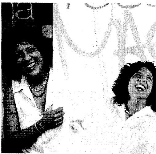
Rosana, en la presentación de su disco 'Magia'.

MÚSICA | La artista canaria reivindica su papel de cantautora en un trabajo que sale a la venta el próximo lunes