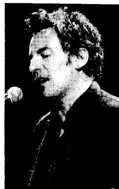
Bruce Springsteen.

Durante la gira 'Devils and Dust', Bruce Springsteen actúa sin banda de acompañamiento